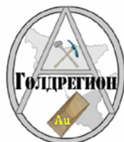
Общество с ограниченной ответственностью «Голдрегион»